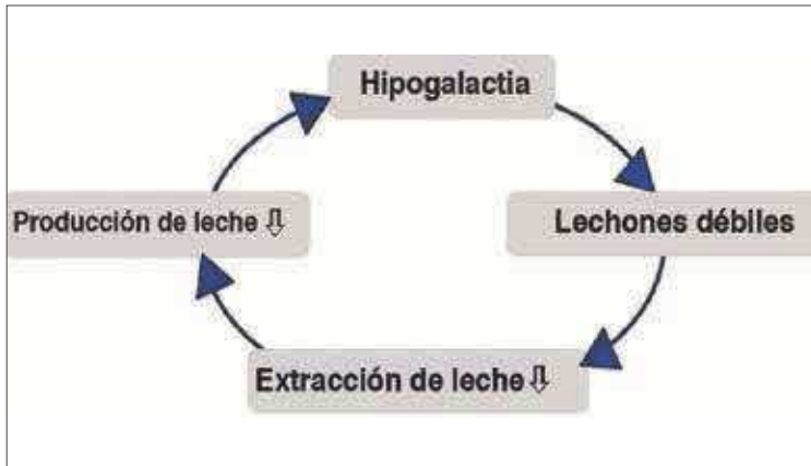
FIGURA 1 El círculo vicioso de la falta de extracción de leche.

comerciales es medir la temperatura rectal después del parto. Sin embargo, esto debe realizarse idealmente en combinación con un examen de los cambios en las glándulas mamarias y la consideración de signos de disminución de la producción de leche o reducción del apetito. El rango de umbrales críticos de temperatura varía entre 39,3° C y 40,5° C (Waldmann y Wendt, 2001), y el tratamiento, principalmente con antibióticos, se administra tan pronto como se superan estos umbrales. Sin embargo, a menudo se observa hipertermia fisiológica en cerdas posparto, especialmente en primerizas, lo que lleva a interpretaciones erróneas (Klopfenstein et al., 2006; Gerjets et al., 2008; Stiehler et al., 2015). Stiehler et al. (2015) enfatizan que la medición de la temperatura debe estandarizarse y medirse a la misma hora del día.