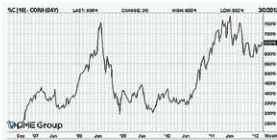
Gráfico 3. Evolución de los precios del maíz.

tuvo una volatilidad extrema y tráficos entre Argentina y el Mediterráneo llegaron a costar primero 120$ y en la caída 16$.