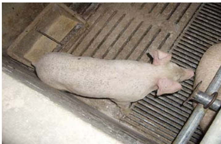
Figura 2. Lesiones cutáneas multifocales distribuidas por el dorso del animal.