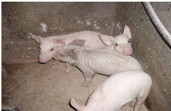
Figura 3. Lechón con el aspecto grasoso característico de la epidermitis cuando afecta a toda la piel.