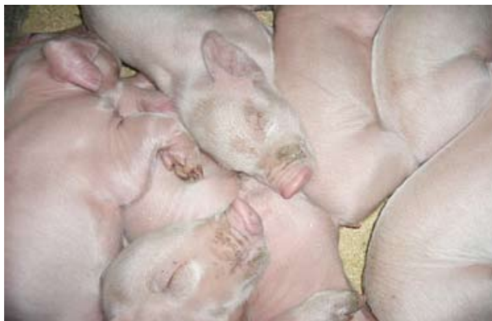
Figura 1. Lesiones en la jeta de un lechón, compatibles con epidermitis exudativa.

Se revisaron las instalaciones y el ambiente, revisando los siguientes puntos: